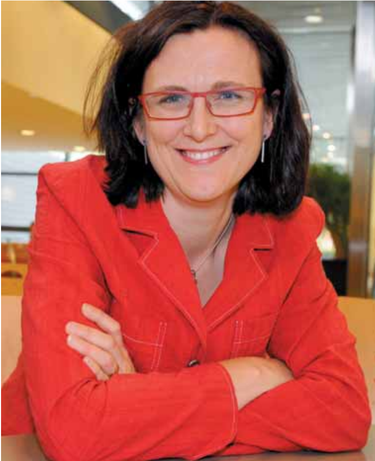
Cecilia Malmström, comisaria europea de Asuntos de Interior

«La trata de seres humanos es la esclavitud de nuestro tiempo y constituye una flagrante violación de los derechos humanos. Es un delito grave que afecta a mujeres, hombres, niñas y niños de todas las nacionalidades y que causa a sus víctimas daños profundos y perdurables. Con el fin de dar protección y asistencia a las víctimas de la trata de seres humanos y ayudarlas a recuperarse en la medida de lo posible, la legislación de la Unión Europea (UE) les otorga una serie de derechos (derecho a asistencia