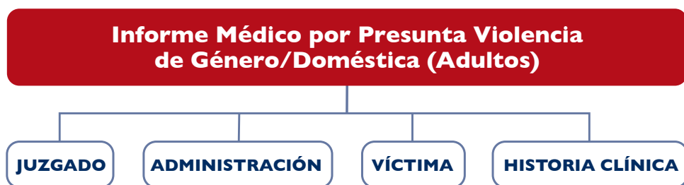
Gráfico 2. Cumplimentación del parte de lesiones por presunta violencia de género o doméstica (adultos)

El informe médico debe ser cumplimentado por el personal facultativo responsable de la asistencia, siguiendo las instrucciones que se señalan en el mismo. Este informe consta de un ejemplar original y tres copias (gráfico 2). El original se remitirá en un sobre cerrado al Juez de Guardia, a través de la Dirección del Centro o de la Policía y Fuerzas de Seguridad. Las tres copias serán para la administración, la interesada y el centro que realiza la asistencia, respectivamente. La copia destinada a la administración, se remitirá también, en un sobre cerrado a la Dirección General de Salud Pública. Ahora bien, es necesario informar a la mujer de su remisión a la autoridad judicial. La copia que se debe entregar a la mujer se hará siempre que no se comprometa su seguridad, dado que puede venir acompañada del presunto agresor o que al llegar a casa el agresor descubra la copia del informe médico. En este caso puede indicarse, que ésta puede entregarse a algún familiar o persona de su confianza.