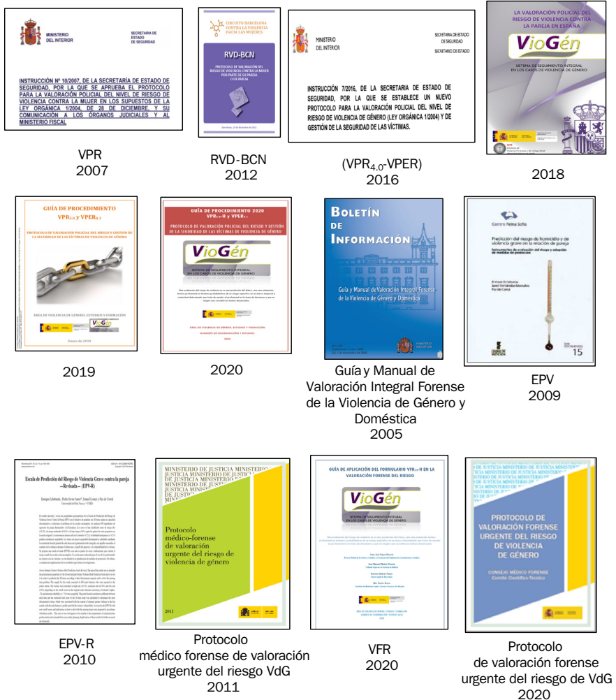
Ilustración 1. Evolución de la valoración del riesgo en VdG en el ámbito policial-forense 2005-2020. Elaboración propia.