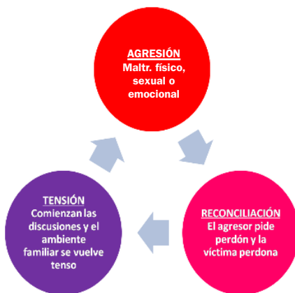
Ilustración 2. Fases del ciclo de la violencia de género