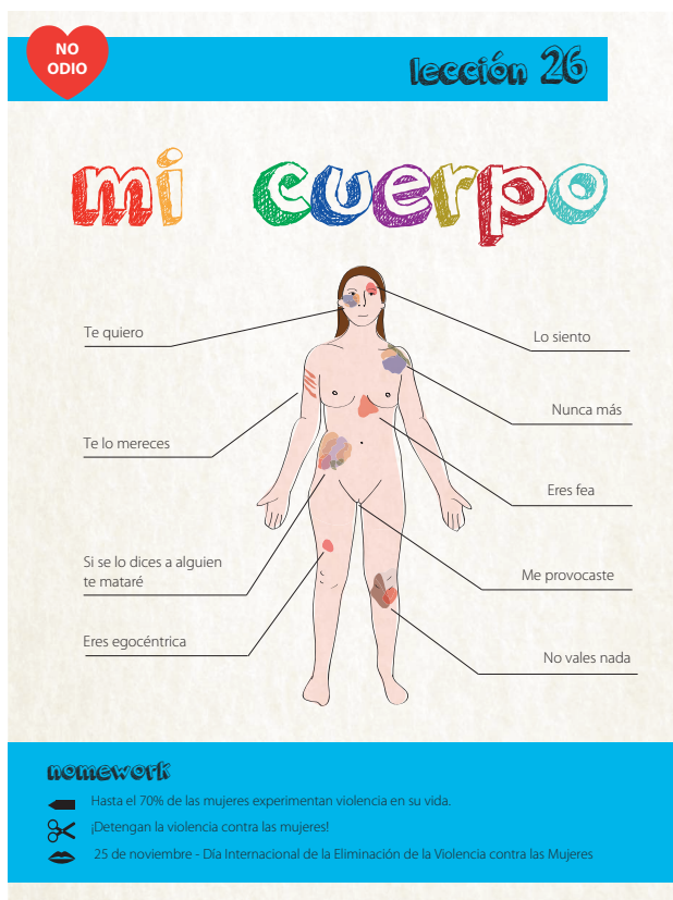
Cartel creado por los No Hate Ninjas (Portugal) para la campaña juvenil No hate movement .