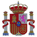
Tabla de contenido